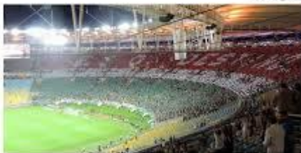
O pó de arroz é marca registrada da torcida do Fluminense nas imediações do Maracanã

De UOL, na Rio de Janeiro 02/02/2014 - 09:00