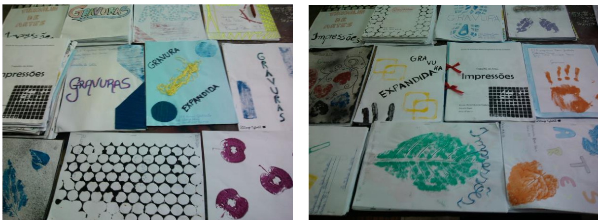
Figuras 6/7 - Resultado dos portfólios

Percebe-se que a criação poética começa pela apresentação da capa, com a elaboração de impressões de diversos materiais como mostra as imagens abaixo, em geral, muito bem confeccionadas.