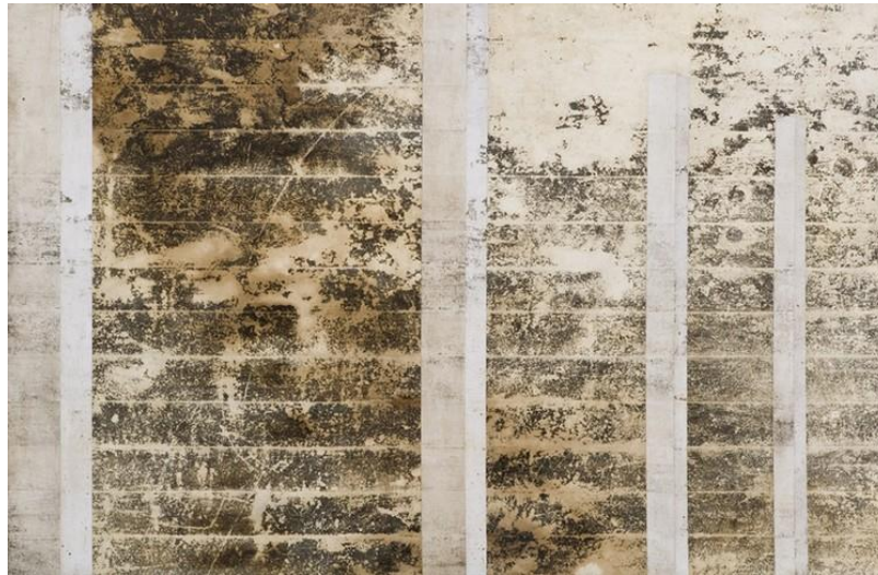
Figura 8 - Sem título. Daniel Senise. Medium acrílico e resíduos sobre tecido em colagem sobre madeira, 130 x 200 cm, 2005.

O artista Daniel Senise se apropria dos restos, dos fragmentos do chão, após transportados para a tela, torna-se a obra, como podemos ver na obra abaixo: