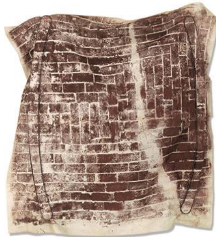
Figura 7 - Sem título, 2005. Série Incêndio – Monotipia sobre lona crua 190 x 215 cm/Coleção do Artista – RJ.

Outro artista gravador, fotógrafo e pintor que se apropria da linguagem subversiva da gravura é Carlos Vergara (Santa Maria-RS, 1941), em 2003 o artista vai aos Sete Povos das Missões, em São Miguel, onde fez impressões utilizando tecidos para gravar sobre as marcas das ruínas da antiga propriedade jesuítica. Em cada viagem, escolhia um determinado lugar e estendia seus lenços e panos para registrar os vestígios do chão e do que mais lhe atraísse o olhar. Esses trabalhos deram origem à série "Sudário" que o artista denominou sendo monotipia.