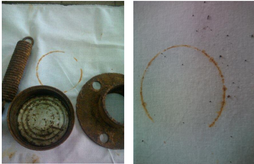
Figuras 3/4 – Impressões com metal