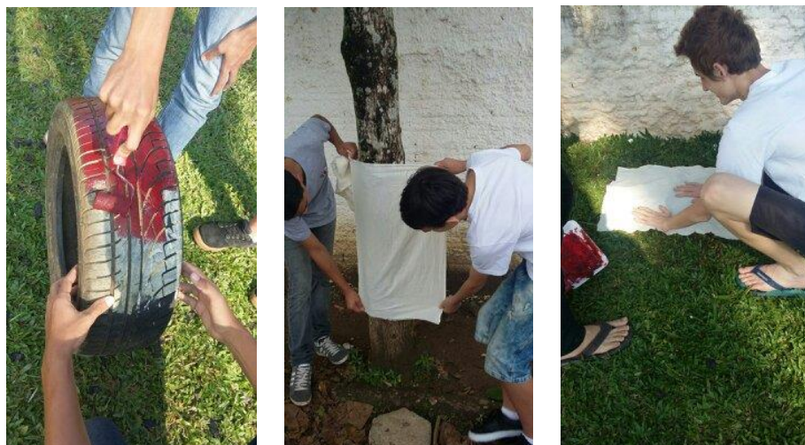
Figuras 3/4/5 - Impressões

Ouve o envolvimento de todos os grupos na exploração dos processos de impressão voltados a frottagem e a carimbagem, todos os grupos desenvolveram essas práticas, ao se apropriarem de folhas de árvores, cascas de árvores, pneus, calçadas, grama, frutas e legumes, entre outros, esses elementos entintados, geraram uma produção rica em informações que foi trazido por muitos objetos e elementos que caracterizam o próprio do espaço. Nesses processos de impressões notou-se que alguns trabalhos ficaram não tão bem resolvidos esteticamente como outros, devido ao uso inadequado da tinta, muitas vezes excesso da mesma, e assim foram descobrindo o “ponto” certo dos entintamentos para se obter um resultado mais elaborado e uniforme.