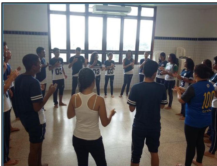
Imagem 8 – Roda de Imitação Rítmica