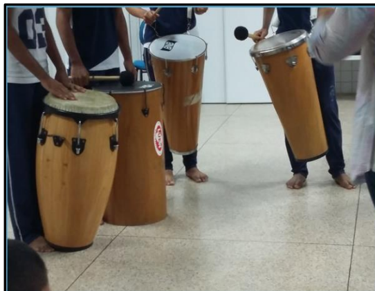
Imagem 11 – Inserção de instrumentos musicais