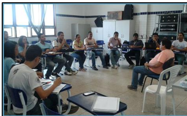
Imagem 1 – Reunião de formação em 2014

A imagem abaixo, mostra uma de nossas reuniões semanais, realizada no segundo semestre de 2014, onde tivemos a oportunidade de ouvir uma palestra com um dos técnicos do NAPENEE, com o tema: Educação inclusiva para pessoas cegas.