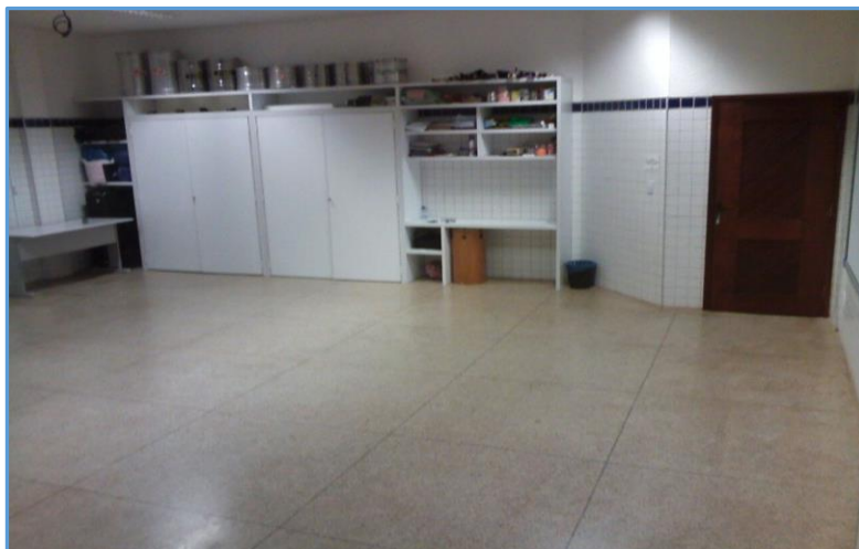
Imagem 3 – Sala de música em 2016