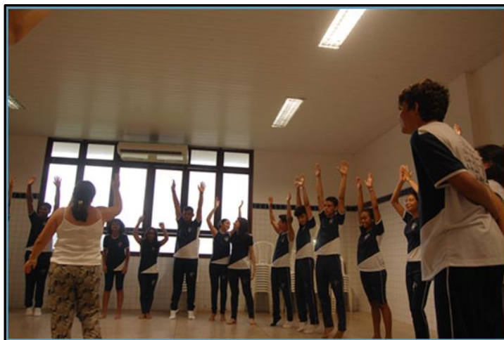
Imagem 4 – Parte do público da oficina durante uma das atividades

A elaboração da proposta (ver Apêndice 1 35 ) e a seleção do público-alvo levou em conta as características dessas turmas, previamente analisadas junto à coordenação, alguns professores e o próprio NAPNEE, e a disponibilidade dos horários para a realização da oficina, pois contávamos com a colaboração dos colegas professores dessas duas turmas para que as atividades acontecessem no período vespertino, quando os alunos estão regularmente na escola, nesta configuração de classe regular. Como as duas turmas ainda não haviam tido a disciplina Arte – linguagem artística música, o encontro deveria ser de fácil acesso aos alunos, a fim de que todos pudessem participar.