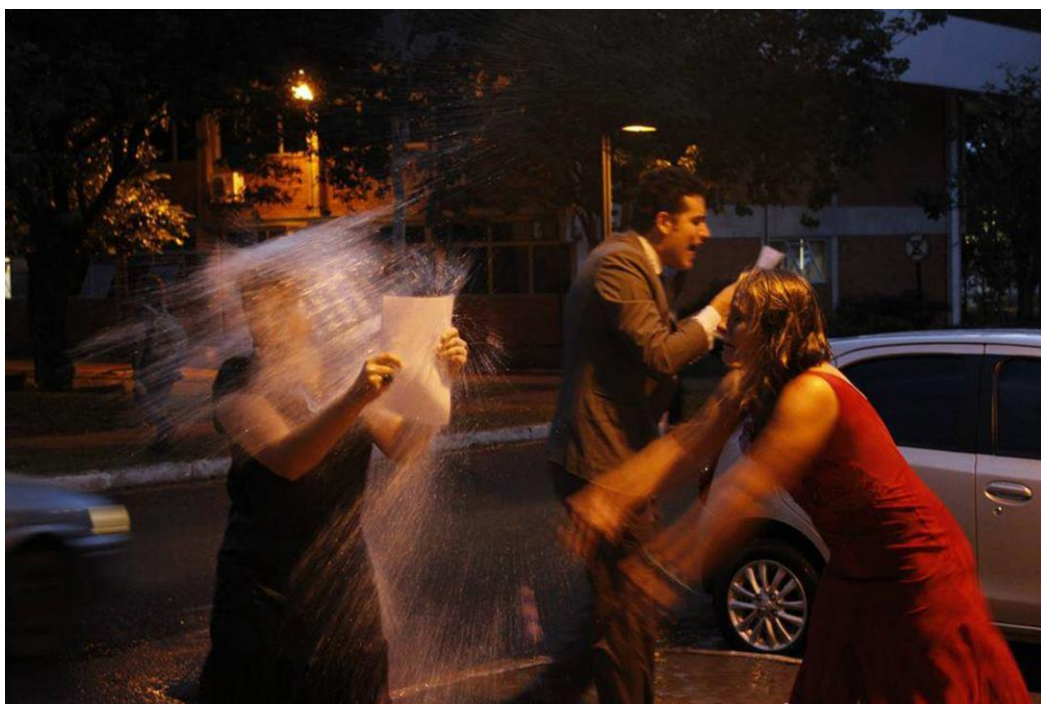
Imagem 3 –Performance Caçada - registro de apresentação realizada em frente ao Bloco 3M.

Caçada , a performance que apresentamos, nasceu de um exercício cênico do grupo para a montagem do texto dramático Rinoceronte , de Ionesco, e de nossa crise financeira, forçando-nos a pensar em ações para a ocupação de espaços não convencionais do teatro. Ela se iniciava com um dos atores proferindo um fragmento de Rinoceronte , ao que depois era tocada uma música erudita. Qualquer um dos atores podia pegar um dos fragmentos de textos do varal e começar a ler e, enquanto isso, os atores que estavam sem texto jogavam bexigas d'água em quem lia. Em determinado momento chamávamos o público para participar da ação, depois começávamos a pedir “dinheiro! dinheiro! dinheiro!” ao público e encerrávamos com uma partitura de movimento, inspirada em nossos espetáculos.