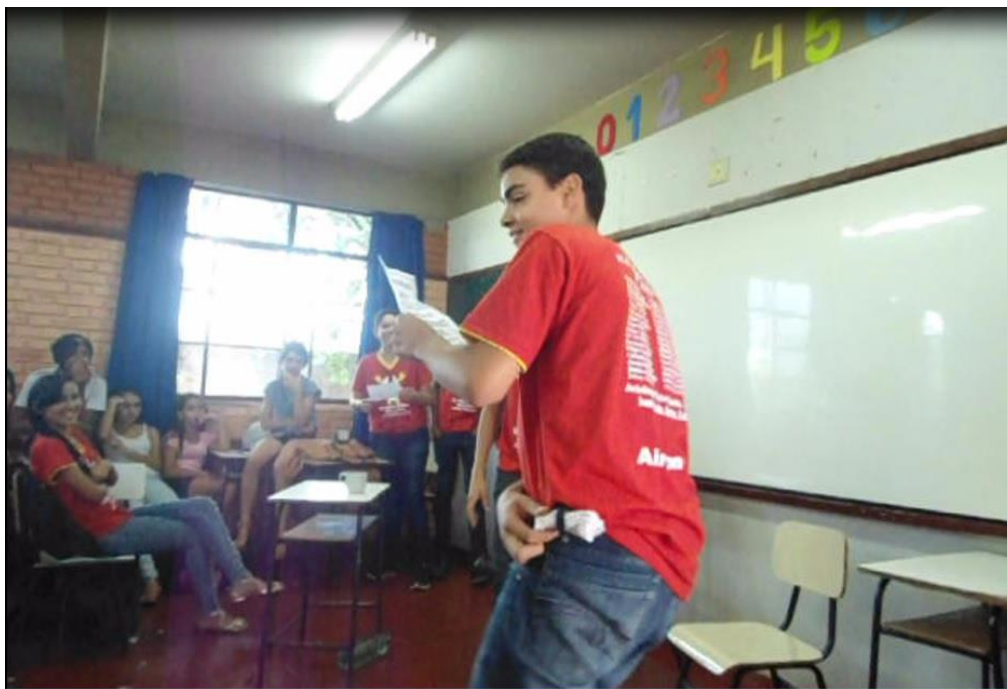
Imagem 2 – Registro de aula. Na foto, o aluno segura sua “arma”, um pedaço mortal de papel higiênico, capaz dos mais terríveis cortes.

Com isso, ao final da aula, propus uma tarefa aos alunos-jogadores: eles deveriam construir uma cena em grupo com o tema violência para ser apresentada à turma em nosso próximo encontro. Nessa cena, eles deveriam utilizar determinados objetos, atribuindo-lhes, assim como no jogo em sala, significados diferentes da atribuição cotidiana e utilitária do objeto.